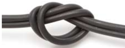
Nó em um Cabo Drop RealFlex™ 5