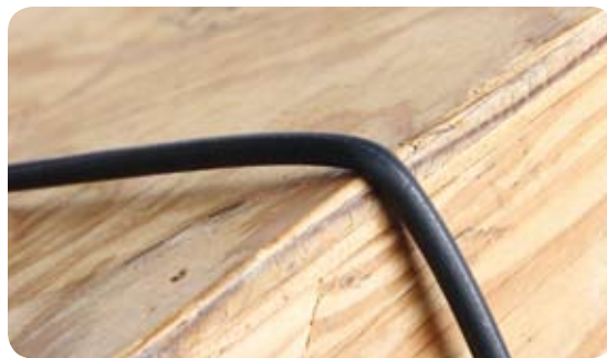
Curva de 90 graus com o Cabo Drop RealFlex™ 5